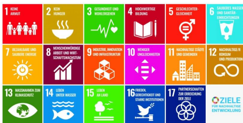
Abbildung 1: „17 Sustainable Development Goals - SDGs (UN)“

Die Anstrengungen von PROLICHT zielen darauf ab, alle an den Geschäftsprozessen Beteiligten wie Partner, Kunden, Lieferanten aber auch Mitarbeiterinnen und Mitarbeiter dazu zu bewegen, die Bemühungen hinsichtlich „Nachhaltigkeit“ zu unterstützen. Im Nachhaltigkeits-Strategiepapier bekennt sich PROLICHT dazu, das unternehmerische Handeln und Denken nach den 17 Zielen für nachhaltige Entwicklung der Vereinten Nationen auszurichten.